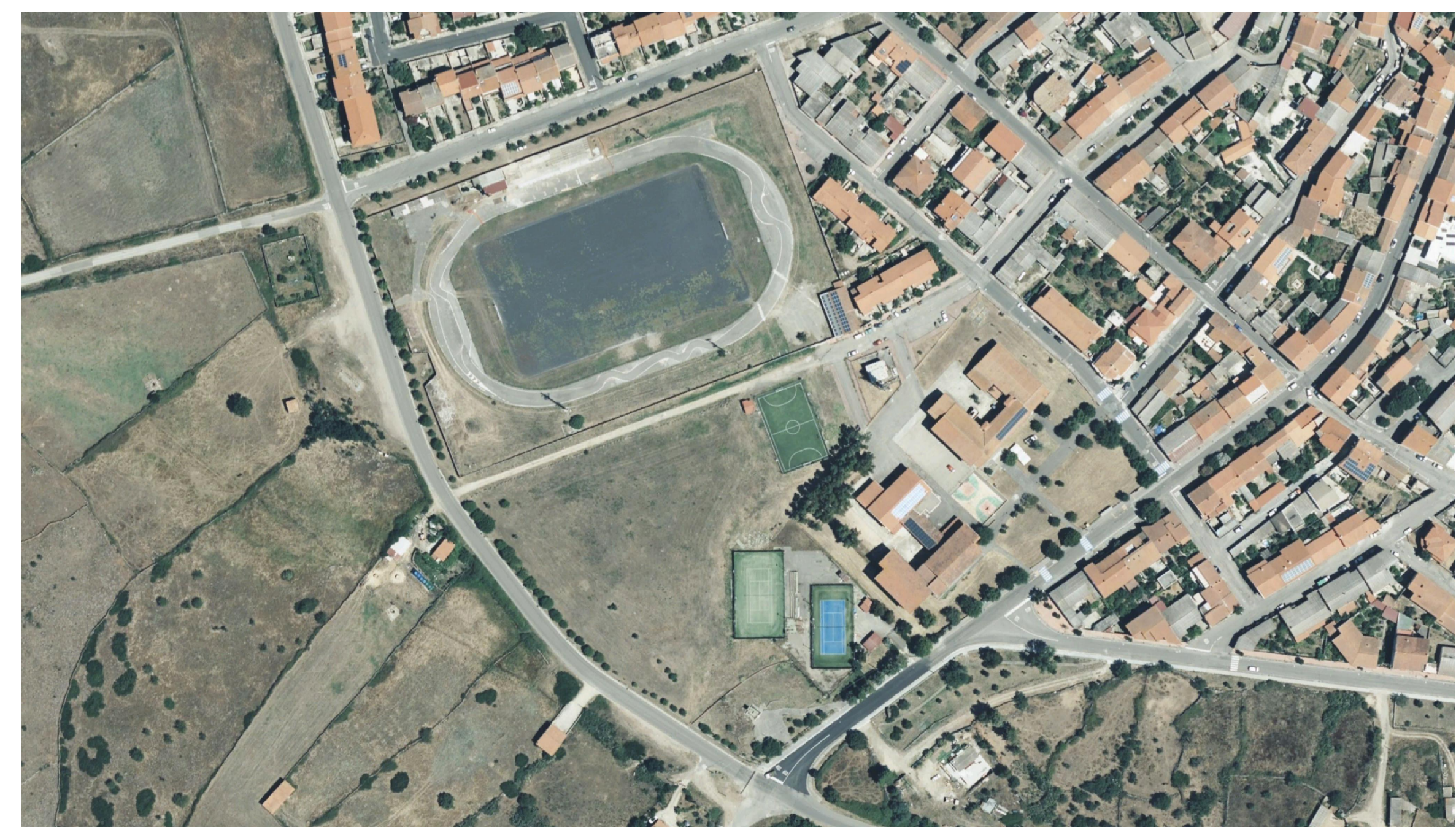
Vista aerea zenitale