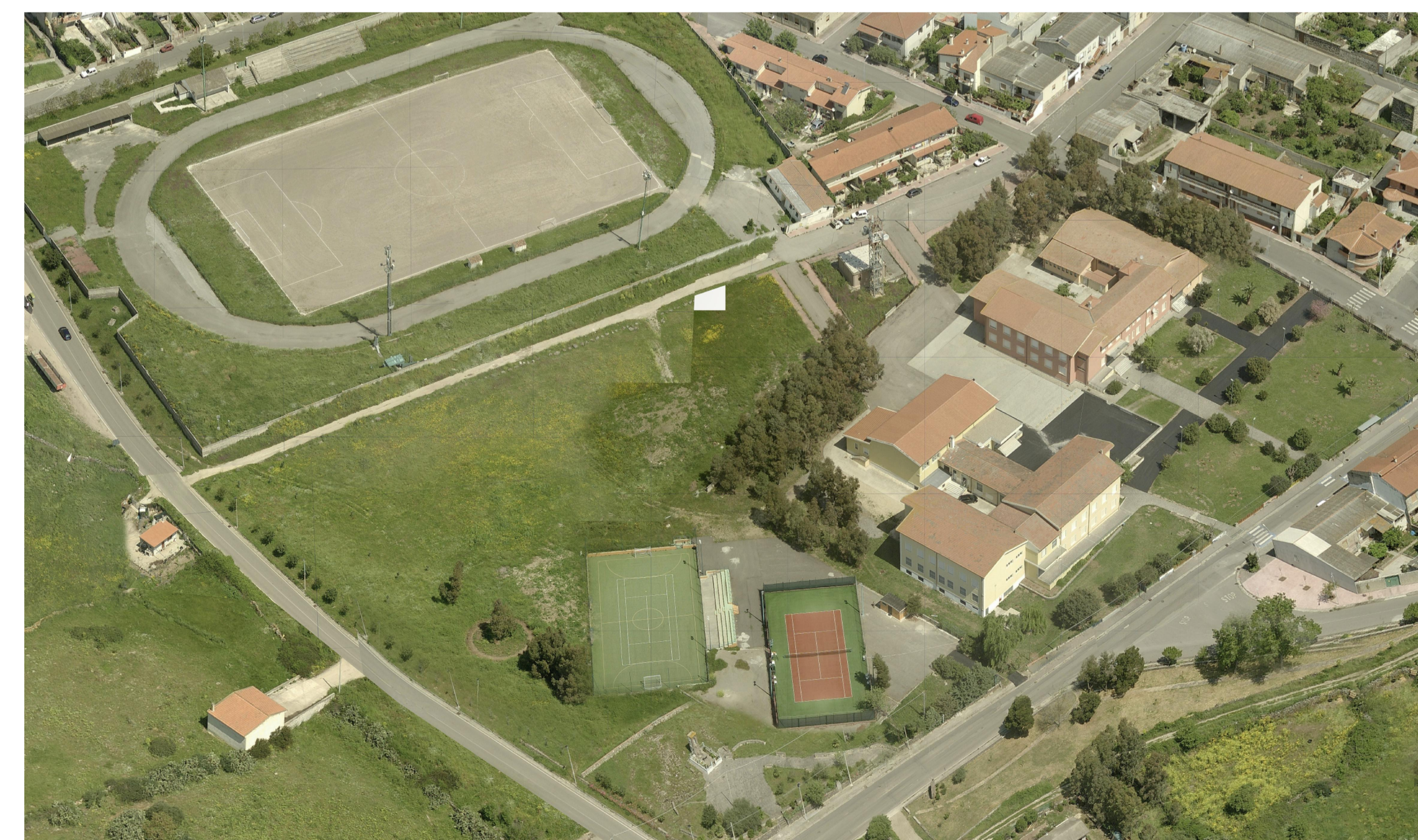
Ripresa aerofotogrammetrica dell'area a 45 gradi