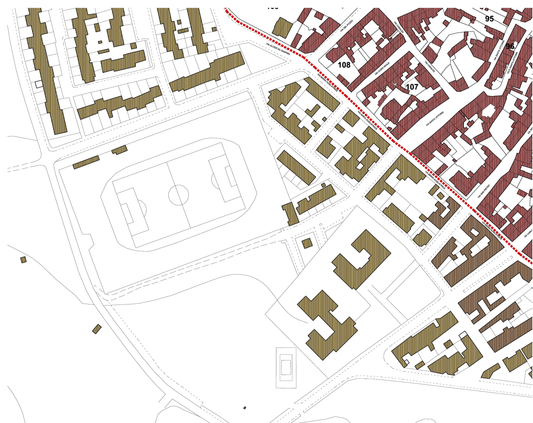
Stralcio PPCS - scala 1:2000