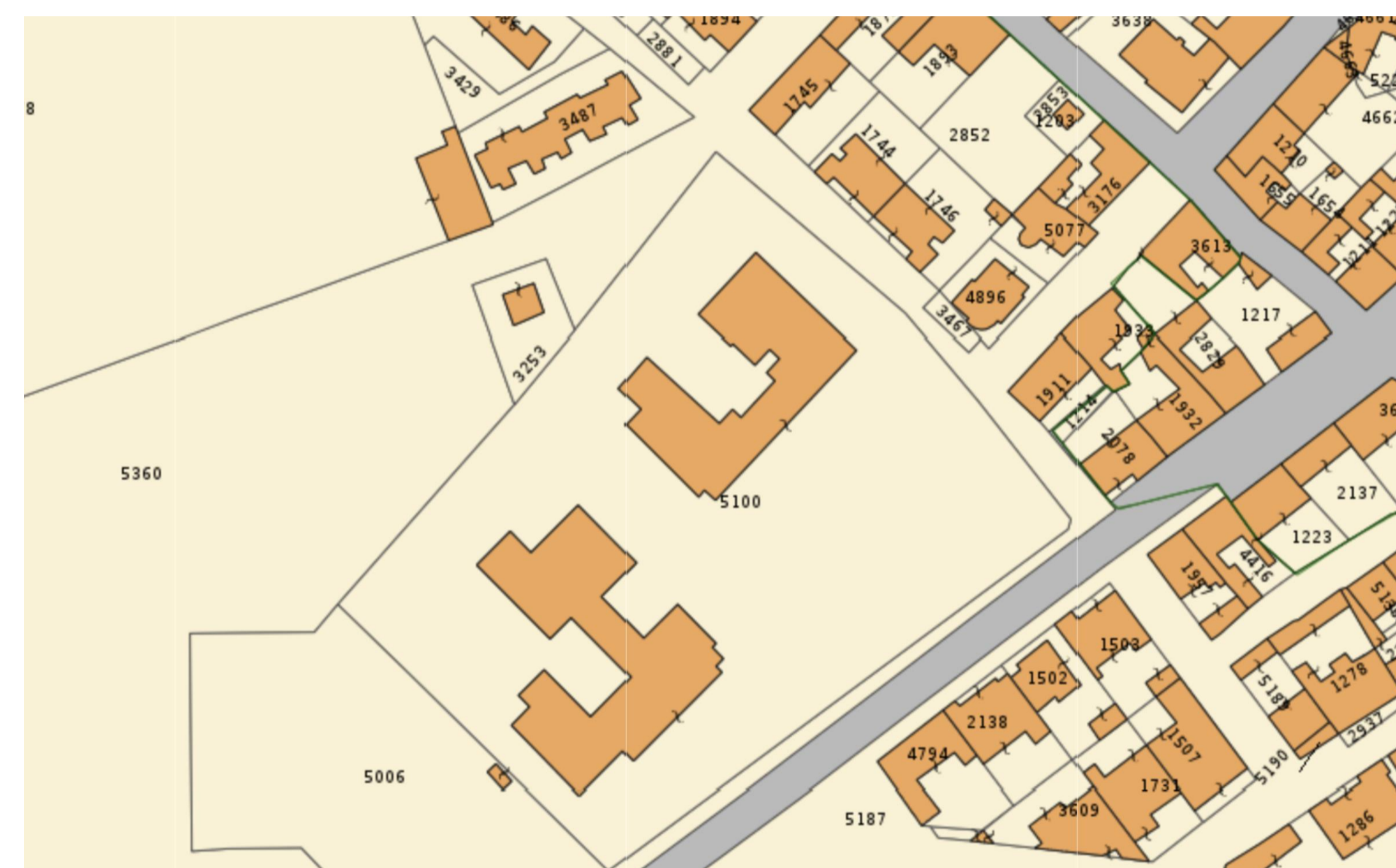
Stralcio planimetria catastale - scala 1:1000