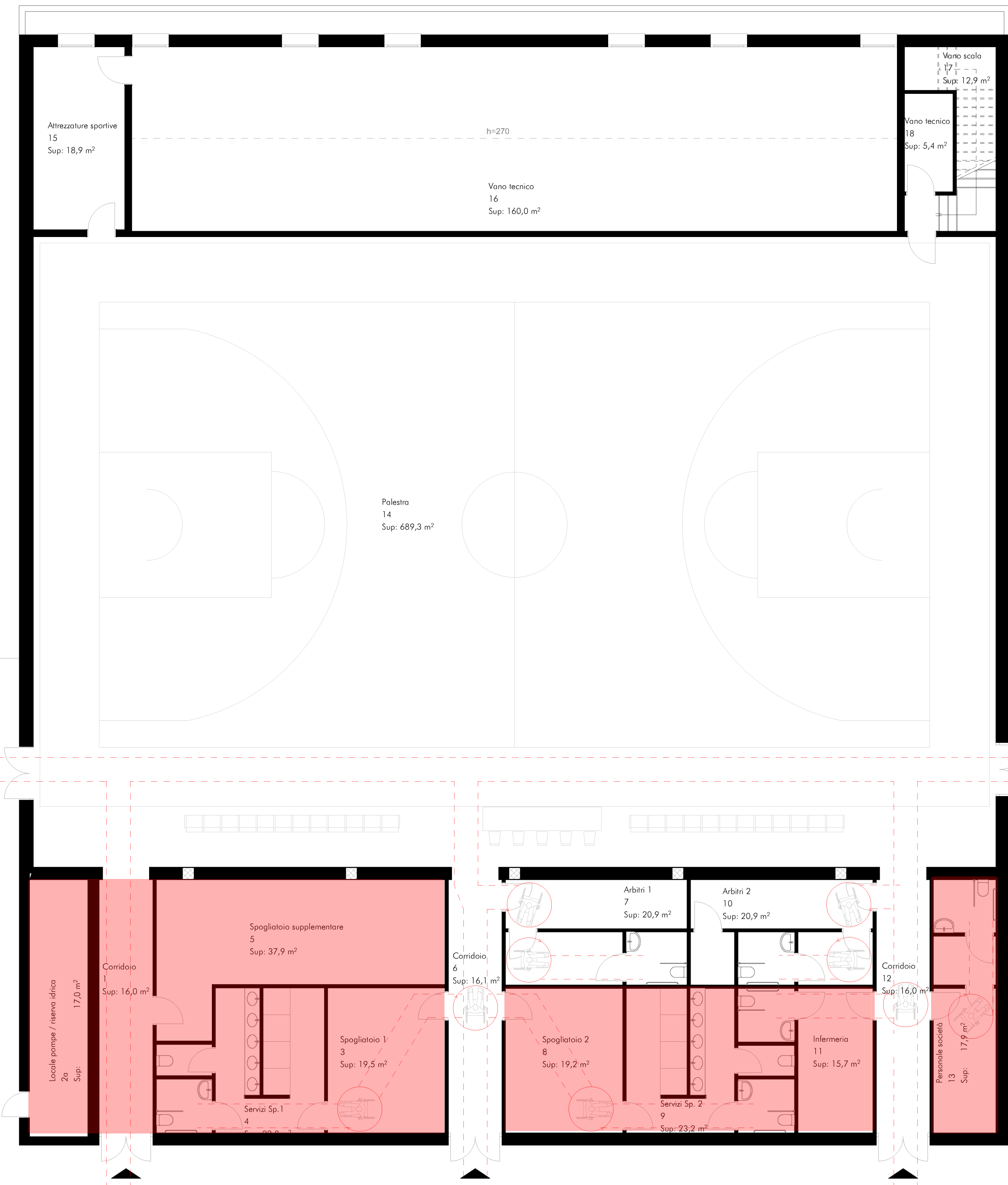
1 Piano Terra 1:100

Area esclusa dall'appalto, si prevedono esclusivamente le predisposizioni impiantistiche (vedasi computo per maggiori dettagli)